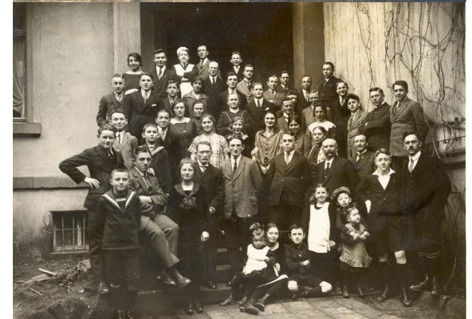
(Heimvolkshochschule Diemerstein 1926; 2. Jahrgang der Bauernvolkshochschule)